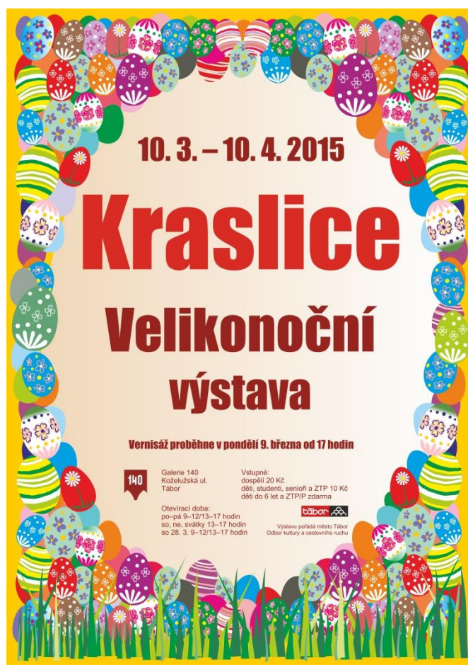
Fotografie z vernisáže – 9. března 2015